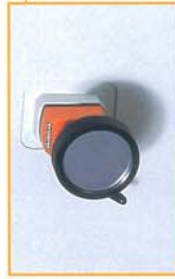
ハンドルにてコンベア幅の設定が可能です。 The width of the conveyor can be set with the handle.

電装システムは全て装置前面下部に設置。メンテナンステープも簡単に行えます。 All electrical systems are installed on the lower front side of the system. 前後設備とインターフェースも標準装備。SMEMAはオプションとなります。 Standard with the interface connection between the front and rear equipment. Option for SMEMA specifications.