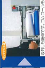
ゴムロール清掃。(IPA等を使用します。)