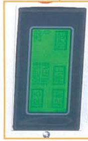
基本操作はタッチパネルとなります。(日文/英文の選択が可能です) A basic operation uses a touch panel. Can choose English or Japanese language.