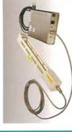
メンテナンステープの高精度イオナイザーです。