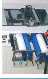
前面タイプの装置です。