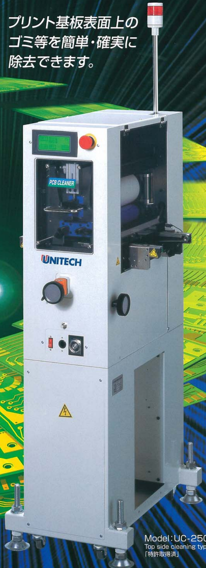
Model: UC-250M Top side cleaning type [特許取得済]