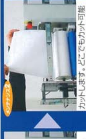
取外しも簡単です。ゴムロールも同じ要領で取外し可能です。