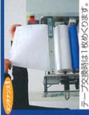
テープ交換時は1枚めくり可能です。(※標準テープ使用時)