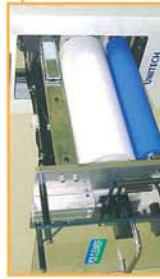
引き出し部を引いた状態でロール交換等が行えます。 The roll exchange can be done with the drawing out part pulled position.